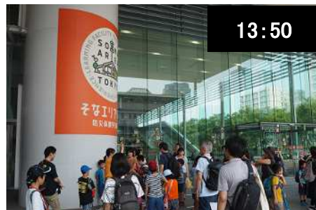
＜そなエリア東京＞ 首都直下地震後の 72 時間を疑似体験