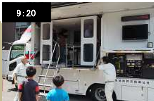
＜消防局庁舎＞ 地震体験、放水体験、指令センター見学など