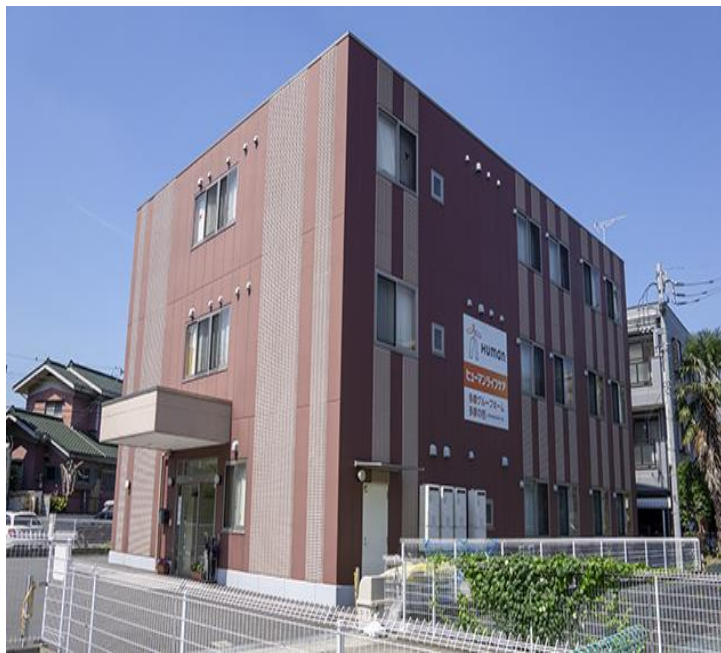
JR南武線「中野島駅」徒歩10分