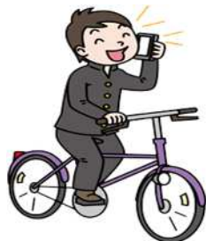
ながらスマホ禁止