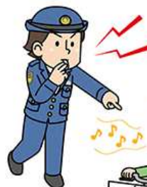
イヤホンをしながら運転禁止